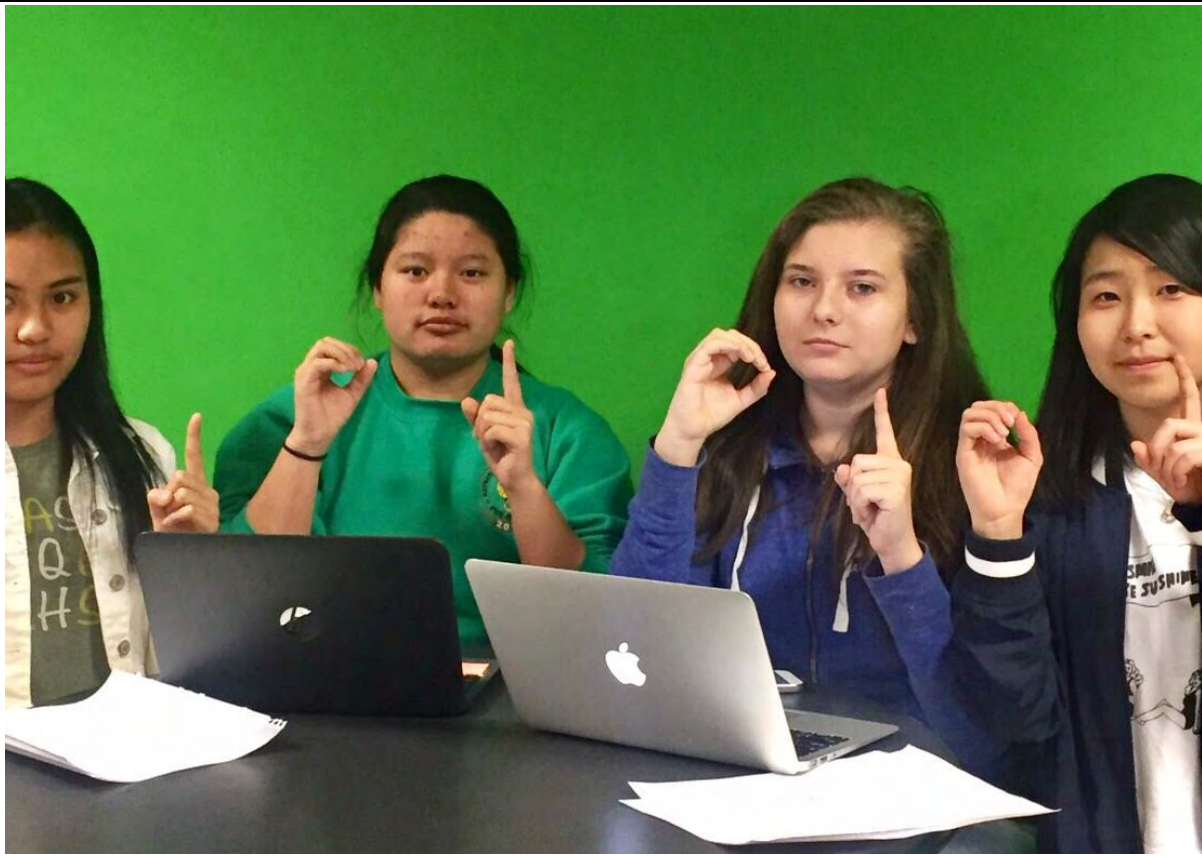
ニュース番組撮影の様子。タイトルはAmzing10です。