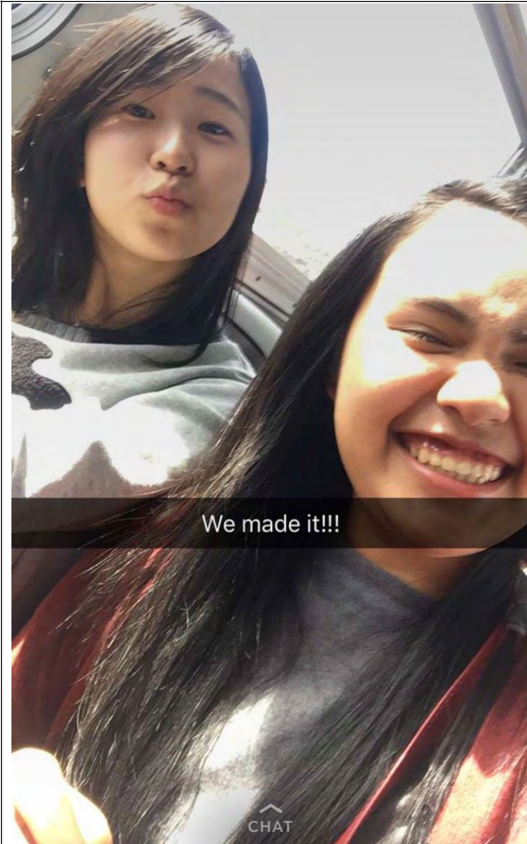
モールにバスで行きました。